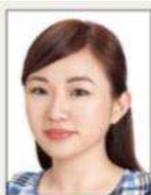
頭部側向一邊、未正視鏡頭