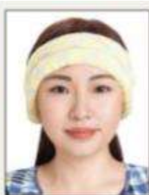
臉部及雙耳被物品遮蔽