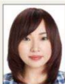
頭髮遮蔽到眼睛或耳朵