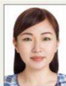
使用有色隱形眼鏡