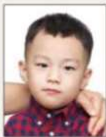
非獨照，出現其他人、物影像